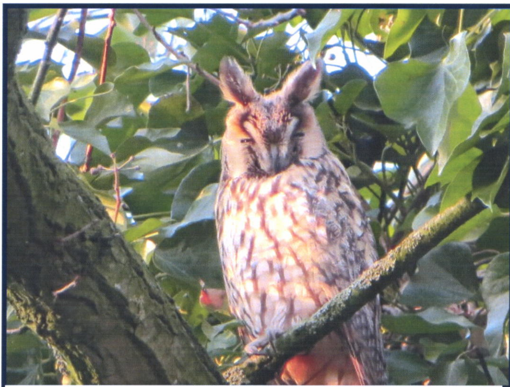
Waldohreule, entdeckt von K. Lübken in einem Eichenbaum auf seinem Hofgelände

Herausgegeben vom Heimatverein Wipplingen