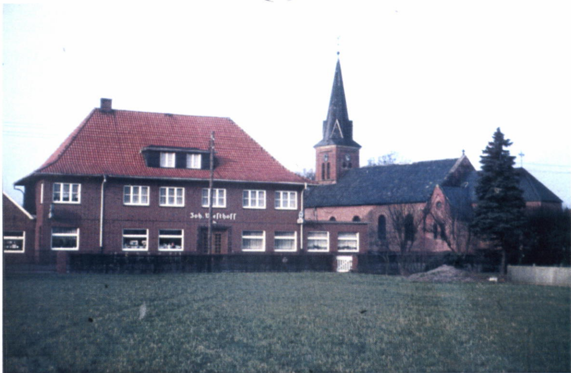
▲ Geschäft, Gaststätte, Festsaal und Übernachtung unter einem Dach: Das Haus Westhoff im Jahre 1981