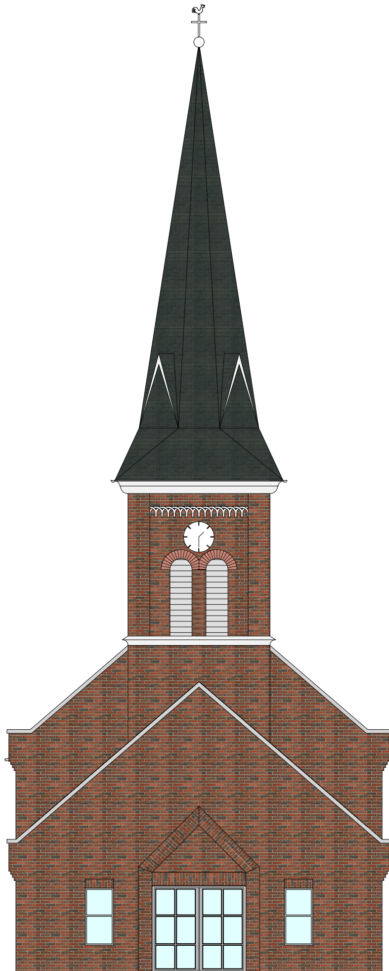
Variante A1a West-Ansicht

Sanierung des denkmalgeschützten Kirchturms mit Umgestaltung der integrierten Leichenhalle