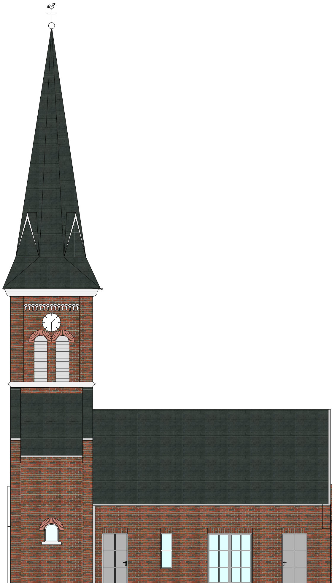
Variante A1a Nord-Ansicht

Sanierung des denkmalgeschützten Kirchturms mit Umgestaltung der integrierten Leichenhalle