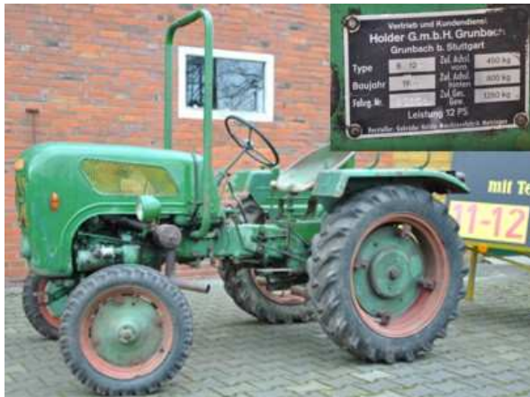
Verlosung 2010: Erster Preis Holder B12

Es werden Old- und Youngtimer, sowie Besucher aus der gesamten Weser-Ems-Region und den benachbarten Niederlanden erwartet.