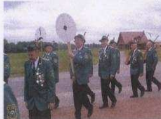
Unsere Schützen mit Königsscheibe

Um 8.00 Uhr feiern wir eine Heilige Messe zum Gedenken an die Opfer beider Weltkriege sowie für die Lebenden und Verstorbenen der Gemeinde Wipplingen.