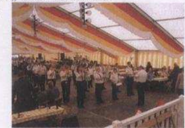
Der Tambourcorps Niederkassel im Festzelt

Ab 20.00 Uhr Festball mit der Top- Band „ Sun Beach “.