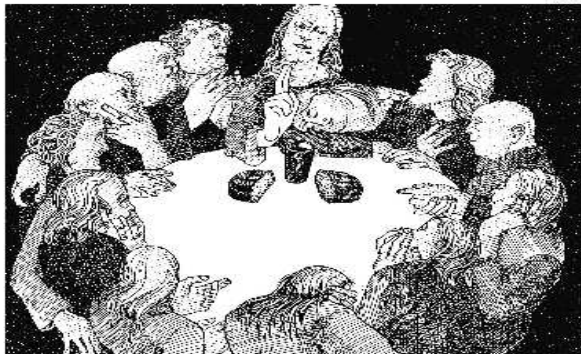
Teilhaben an dem Leben, das dem Tod den Schrecken nimmt!

Einmal, Angestellte, Verzweigte, die alle eines sind: Sie suchen die Nähe Christi, lehnen sich an Jesus, der von sich sagt: „Ich bin das Brot des Lebens“, wird von den Jüngern genannt wie das Brot. Er allein kann Frieden und Leben im Schmerz, er der Verweilende und der Durchgehende sein Licht ihre Finsternis erhellen. Ihren Haart geben? Ihre Finsternis? Ja, aber nicht nur ihre, sondern auch unsere, auch Haart uns.