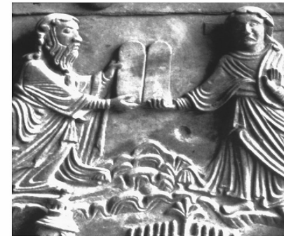
Bronzerelief, Verona 12. Jh.